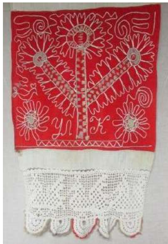
Полотенце ручной работы. д. Покровское, Медвежьегорский район, нач. XX века Из фондов Медвежьегорского районного музея

Свадебное полотенце произведено на ТОО НХП «Заонежская вышивка» в 1994 году.