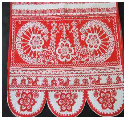
Свадебное полотенце, машинная вышивка. с. Шуньга, Медвежьегорский район, ТОО НХП «Заонежская вышивка», 1994 г. Из фондов Медвежьегорского районного музея