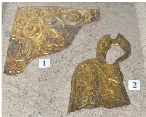
Археологическая коллекция Из фондов Краеведческого музея «Поморье»