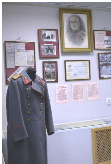
Коллекция личных вещей Ф.Д. Гореленко в постоянной экспозиции Историко- краеведческого музея Суоярвского района