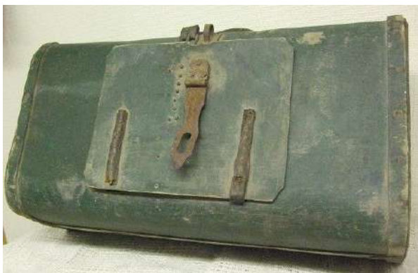
Чемодан 1930-х гг. Кустарное производство