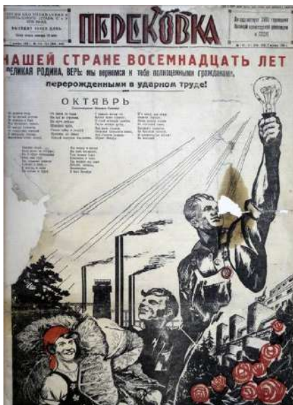
Газета «Перековка», 1935 год