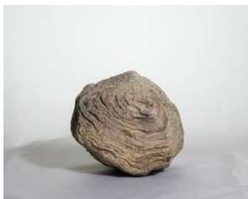
Calevia olenica. Протерозой. Южный Олений о-в, Онежское оз .

Научное и познавательное значение столь необычных окаменелостей, коими являются строматолиты, сложно переоценить, а обилие подобных структур делает Карелию туристическим объектом, заслуживающим большого внимания. Знакомство со строматолитами будет полезно не только специалистам, но и не оставит равнодушными всех тех, кого заинтересовала геология и палеонтология нашего края.