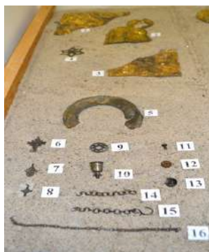
Археологическая коллекция в экспозиции музея